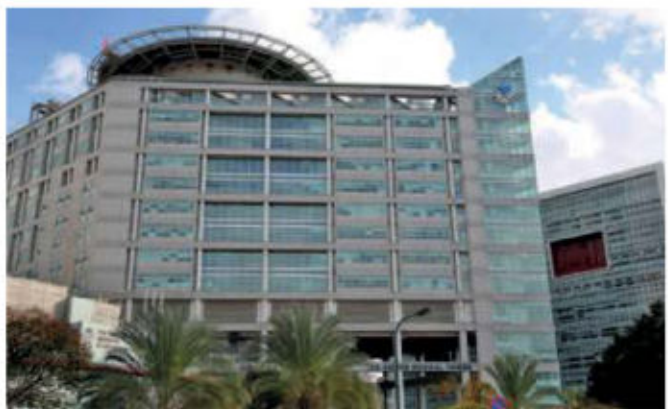
"מנהל המחלקה אמר, 'אף פעם לא קרה לי דבר כזה'". בית החולים איכילוב

כיצוצא משימוש בערשת מנע, והיא נשלחה לבריכת ראייה שהייתה תקינה. לכאורה, תלונה רפואית קלה ושגרתית. בפועל, כאבי הראש האלה העידו על בעיה מסוכנת.